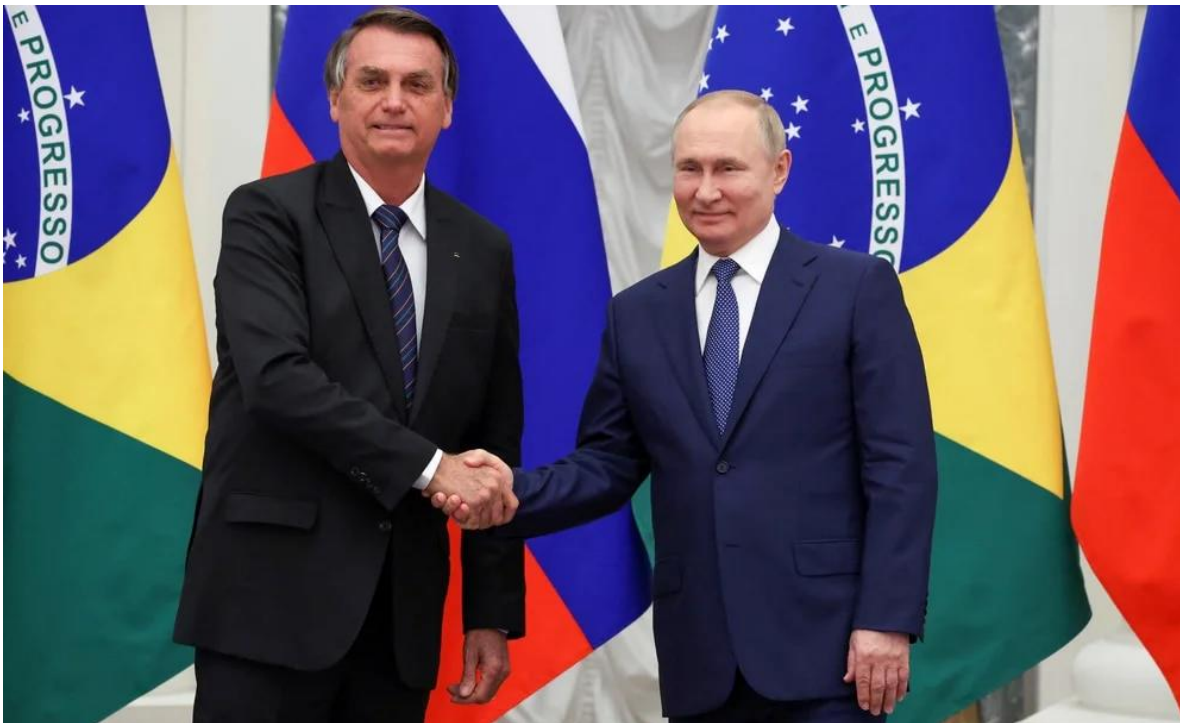
Vladimir Putin, al recibir en Moscú al presidente brasileño Jair Bolsonaro en febrero de este año

Europa prepara un plan para reconquistar Latinoamérica ante la creciente amenaza de que Rusia y China se hagan con el control del mercado . El 27 de octubre habrá un primer encuentro en Buenos Aires entre Ministros de Relaciones Exteriores de la UE y la CELAC (Comunidad de Estados Latinoamericanos y Caribeños) que, según han explicado desde la UE a Infobae, “será una excelente ocasión para dar un nuevo impulso a nuestra asociación y acordar una serie de medidas concretas” .