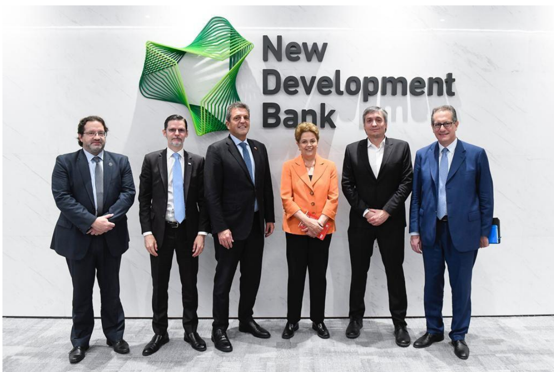
La delegación argentina que visitó a Dilma Rousseff en Shanghai

Rousseff le comunicó a Massa tras la reunión de directorio que se autorizó a tratar el ingreso de Argentina para tratar la incorporación en agosto al banco de los BRICS, que se podría aprobar la primera semana de agosto en Sudáfrica. Cada nuevo integrante es patrocinado por un país miembro y en el caso de la Argentina, el sponsor es Brasil.